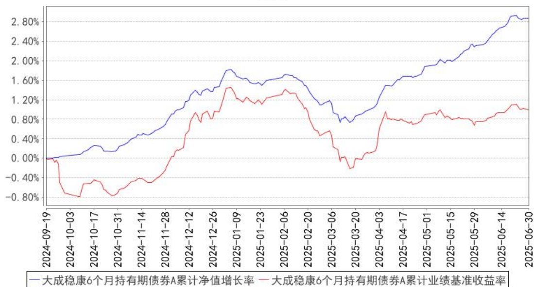
大成稳康6个月持有期债券A累计净值增长率与同期业绩比较基准收益率的历史走势对比图

(二) 自基金合同生效以来基金份额累计净值增长率变动及其与同期业绩比较基准收益率变动的比较