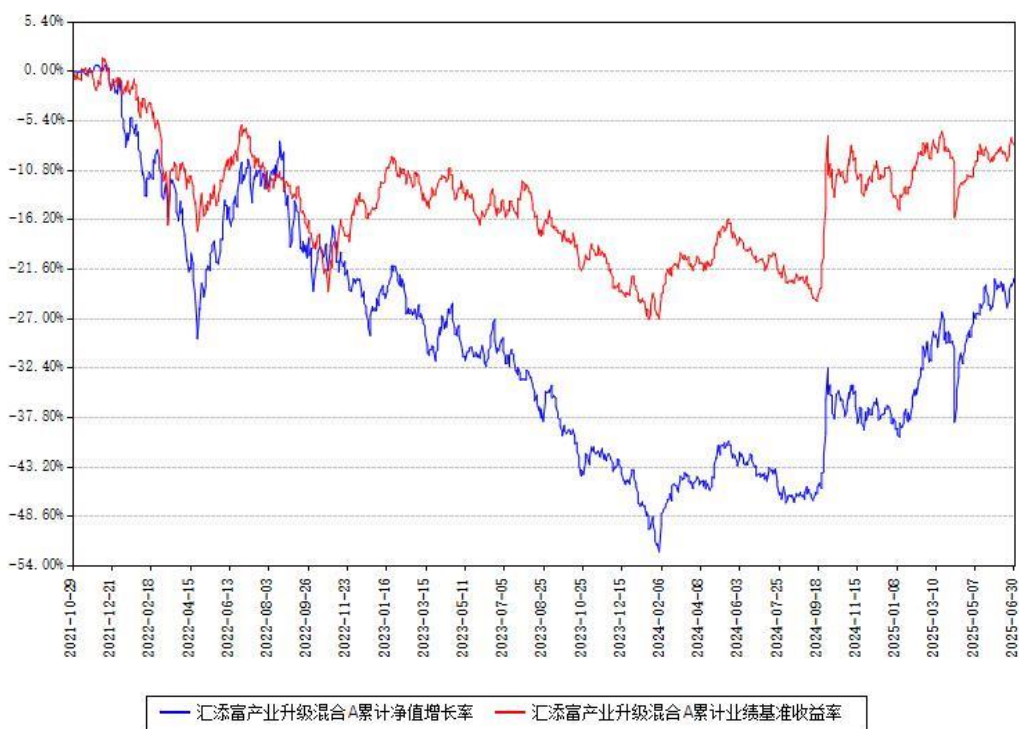
汇添富产业升级混合A累计净值增长率与同期业绩基准收益率对比图

(二) 自基金合同生效以来基金累计净值增长率变动及其与同期业绩比较基准收益率变动的比较图