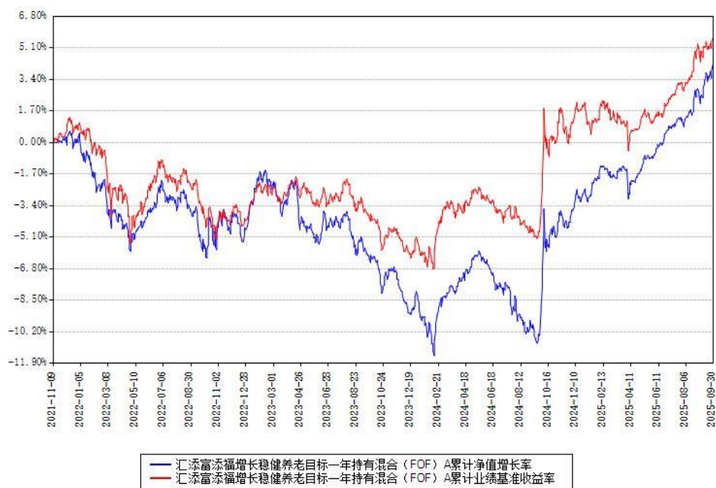
汇添富添福增长稳健养老目标一年持有混合（FOF）Y累计净值增长率与同期业绩比较基准收益率对比图