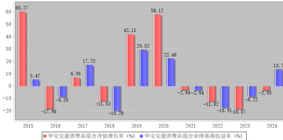
华宝宝康消费品混合每年净值增长率与同期业绩比较基准收益率的对比图