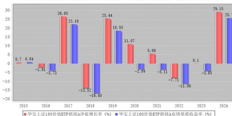
华宝上证180价值ETF联接A每年净值增长率与同期业绩比较基准收益率的对比图