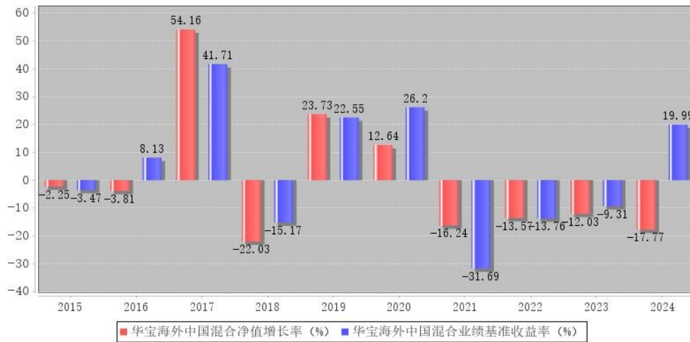
华宝海外中国混合每年净值增长率与同期业绩比较基准收益率的对比图