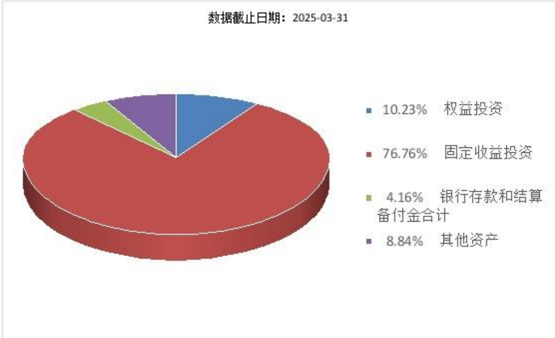
(二) 投资组合资产配置图表/区域配置图表 投资组合资产配置图表