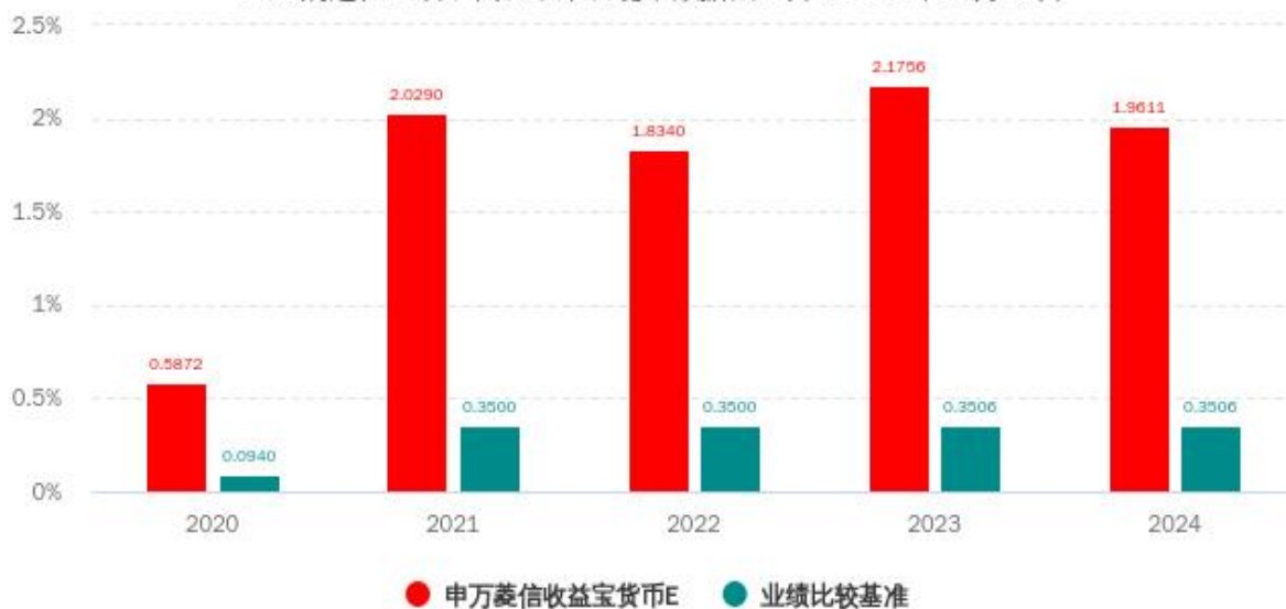
基金的过往业绩不代表未来表现，数据截止日：2024年12月31日