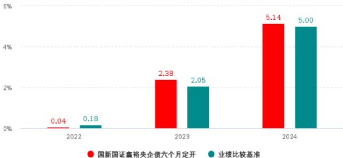
基金的过往业绩不代表未来表现，数据截止日：2024年12月31日