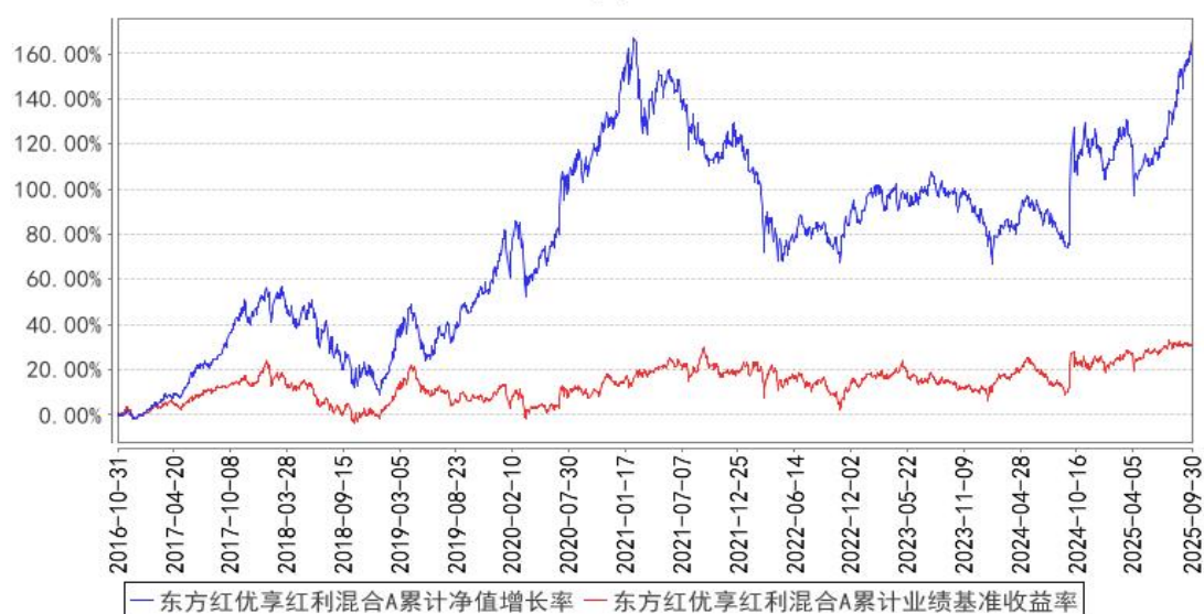
东方红优享红利混合A累计净值增长率与同期业绩比较基准收益率的历史走势对比图

2、自基金合同生效以来基金累计净值增长率变动及其与同期业绩比较基准收益率变动的比较