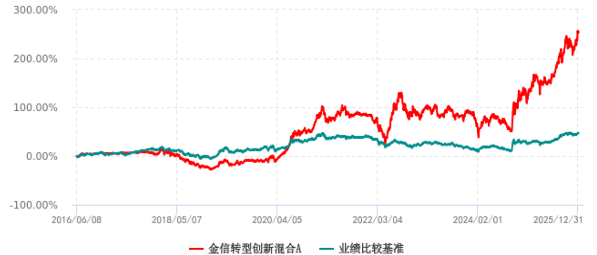
金信转型创新混合A累计净值增长率与业绩比较基准收益率历史走势对比图 (2016年06月08日-2025年12月31日)