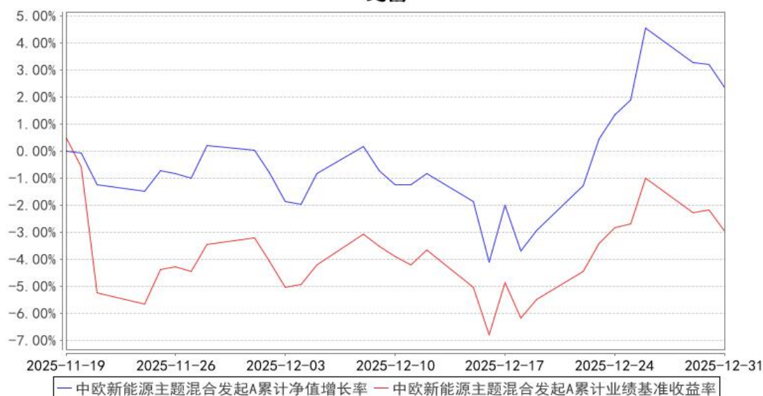
中欧新能源主题混合发起A累计净值增长率与同期业绩比较基准收益率的历史走势对比图

注：本基金基金合同生效日期为 2025 年 11 月 19 日，自基金合同生效日起到本报告期末不满一年，按基金合同的规定，本基金自基金合同生效起六个月为建仓期，建仓期结束时各项资产配置比例应当符合基金合同约定。