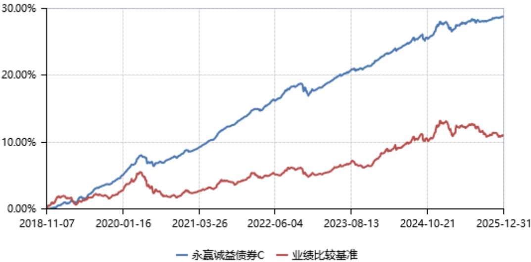
永赢诚益债券C累计净值收益率与业绩比较基准收益率历史走势对比图 (2018年11月07日-2025年12月31日)