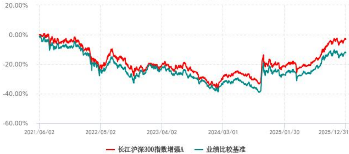
长江沪深300指数增强A累计净值增长率与业绩比较基准收益率历史走势对比图 (2021年06月02日-2025年12月31日)

注：（1）本基金的业绩比较基准为沪深 300 指数收益率*95%+商业银行活期存款利率（税后）*5%；（2）本基金基金合同生效日为 2021 年 06 月 02 日。