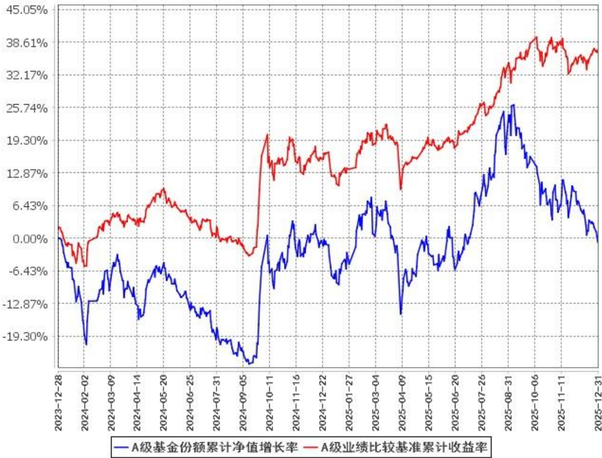
A级基金份额累计净值增长率与同期业绩比较基准收益率的历史走势对比图 (2023年12月28日至2025年12月31日)

注：本基金 C 类份额“自基金合同生效起至今”指 2025 年 9 月 16 日至今。