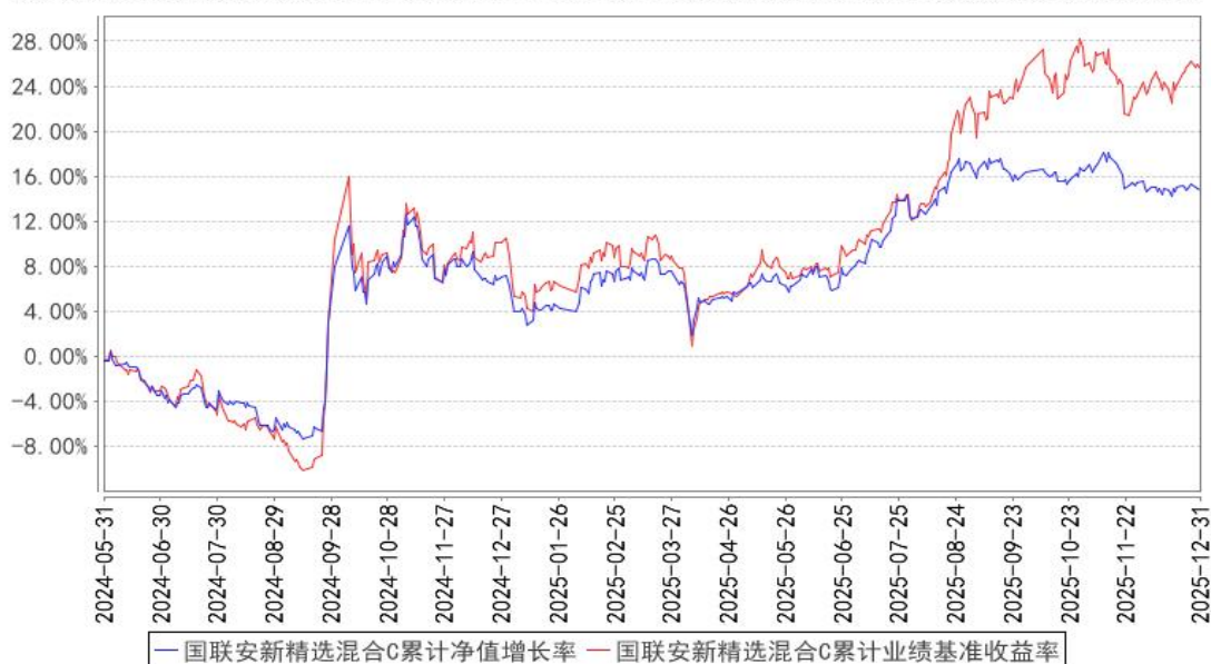
国联安新精选混合C累计净值增长率与同期业绩比较基准收益率的历史走势对比图

4、本基金基金合同于 2014 年 3 月 4 日生效。本基金建仓期为自基金合同生效之日起的 6 个月，建仓期结束时各项资产配置符合合同约定。