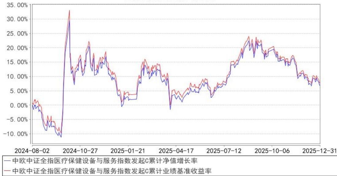
中欧中证全指医疗保健设备与服务指数发起C累计净值增长率与同期业绩比较基准收益率的历史走势对比图

注：本基金基金合同生效日期为 2024 年 8 月 2 日，按基金合同的规定，本基金自基金合同生效起六个月为建仓期，建仓期结束时各项资产配置比例已经符合基金合同约定。