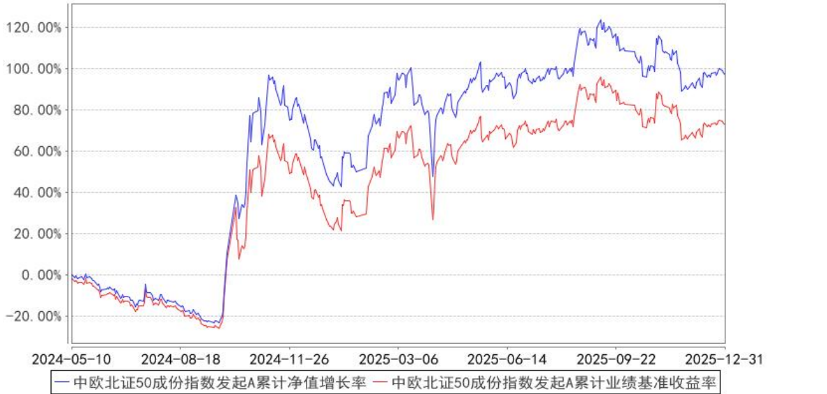
中欧北证50成份指数发起A累计净值增长率与同期业绩比较基准收益率的历史走势对比图