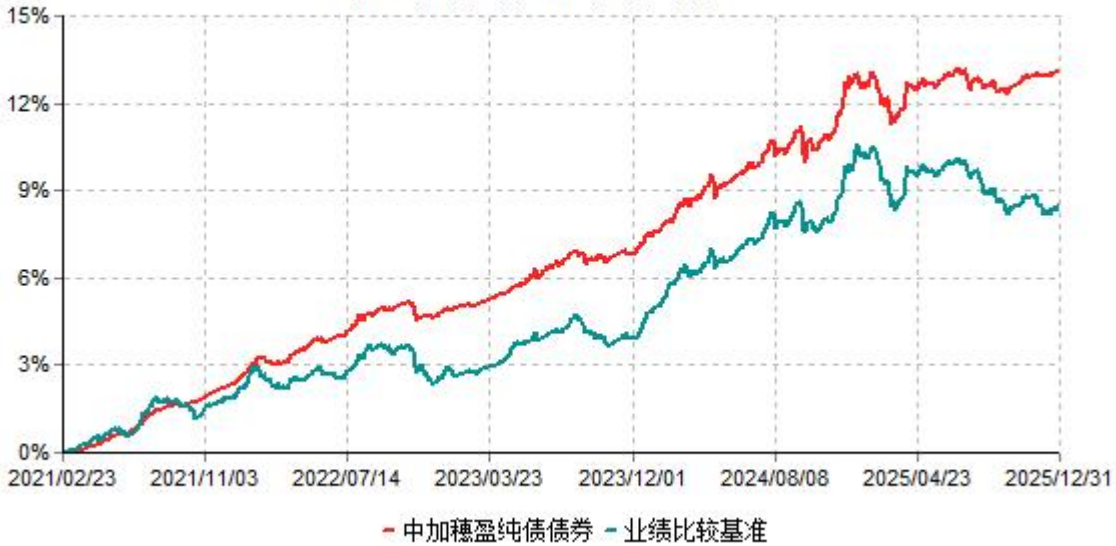
中加穗盈纯债债券累计净值增长率与业绩比较基准收益率历史走势对比图 (2021年02月23日-2025年12月31日)