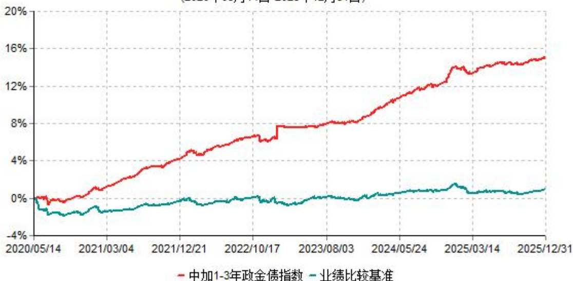
中加1-3年政金债指数累计净值增长率与业绩比较基准收益率历史走势对比图 (2020年05月14日-2025年12月31日)