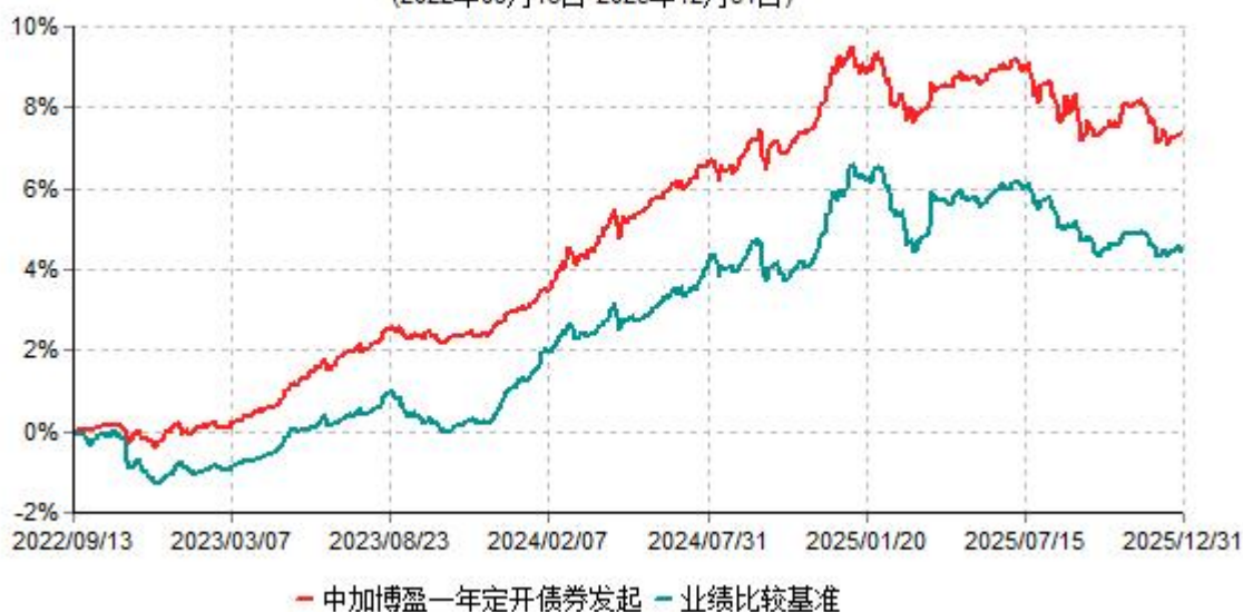
中加博盈一年定开债券发起累计净值增长率与业绩比较基准收益率历史走势对比图 (2022年09月13日-2025年12月31日)