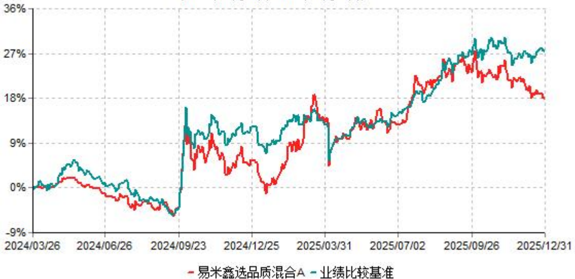
易米鑫选品质混合A累计净值增长率与业绩比较基准收益率历史走势对比图 (2024年03月26日-2025年12月31日)