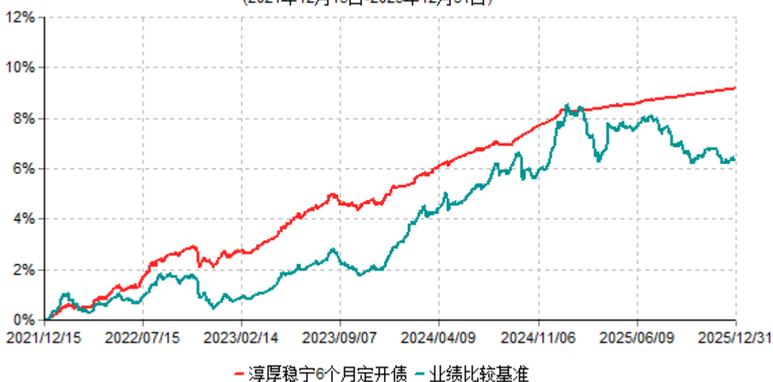
淳厚稳宁6个月定开债累计净值增长率与业绩比较基准收益率历史走势对比图 (2021年12月15日-2025年12月31日)

注：本基金基金合同生效日为2021年12月15日。按基金合同规定，本基金自基金合同生效起6个月内为建仓期。建仓期结束时本基金的各项投资比例均符合基金合同约定。