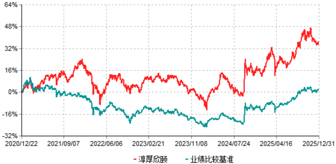
淳厚欣颐累计净值增长率与业绩比较基准收益率历史走势对比图 (2020年12月22日-2025年12月31日)

注：本基金基金合同生效日为2020年12月22日。按基金合同规定，本基金自基金合同生效起6个月内为建仓期。建仓期结束时本基金的各项投资比例均符合基金合同约定。