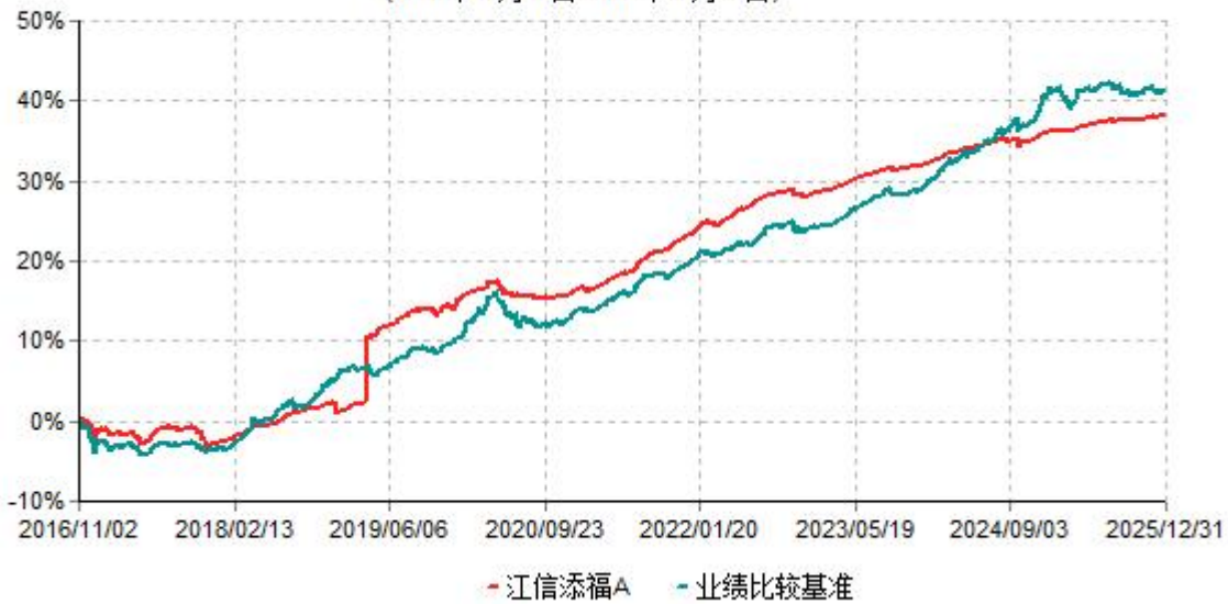
江信添福A累计净值增长率与业绩比较基准收益率历史走势对比图 (2016年11月02日-2025年12月31日)