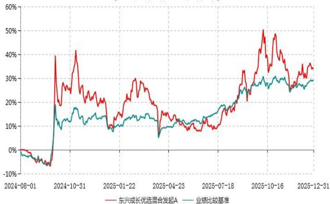
东兴成长优选混合发起A累计净值增长率与业绩比较基准收益率历史走势对比图 (2024年08月01日-2025年12月31日)