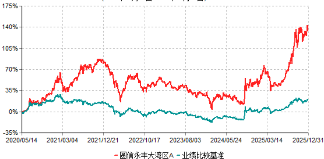
圆信永丰大湾区A累计净值增长率与业绩比较基准收益率历史走势对比图 (2020年05月14日-2025年12月31日)