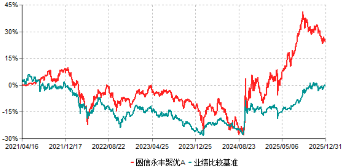
圆信永丰聚优A累计净值增长率与业绩比较基准收益率历史走势对比图 (2021年04月16日-2025年12月31日)