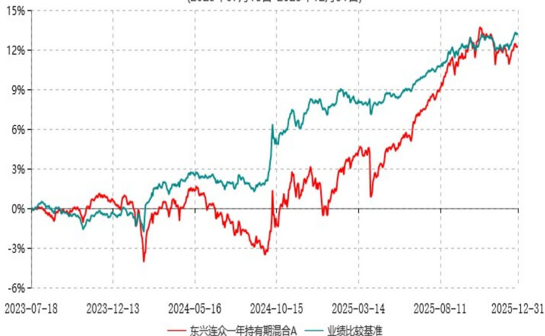
东兴连众一年持有期混合C累计净值增长率与业绩比较基准收益率历史走势对比图