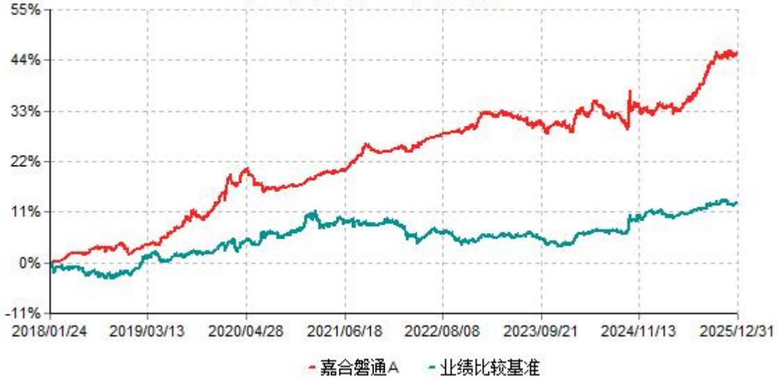
嘉合磐通A累计净值增长率与业绩比较基准收益率历史走势对比图 (2018年01月24日-2025年12月31日)