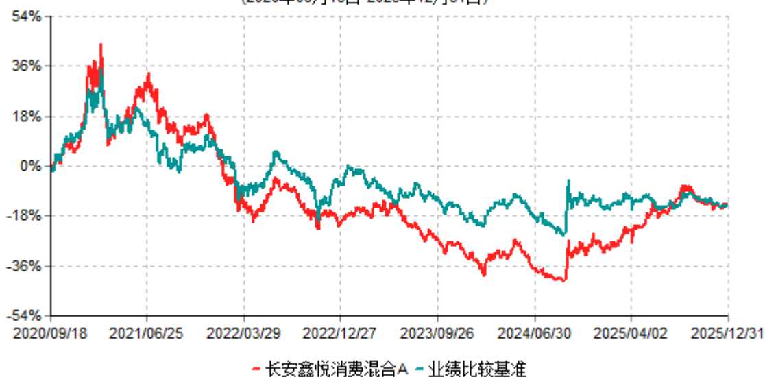
长安鑫悦消费混合A累计净值增长率与业绩比较基准收益率历史走势对比图 (2020年09月18日-2025年12月31日)

根据基金合同的规定,自基金合同生效之日起6个月内基金各项资产配置比例需符合基金合同要求。本基金在建仓期结束后,各项资产配置比例已符合基金合同有关投资比例的约定。本基金于2020年09月18日成立,基金合同生效日至报告期末,本基金运作时间已满一年。图示日期为2020年09月18日至2025年12月31日止。