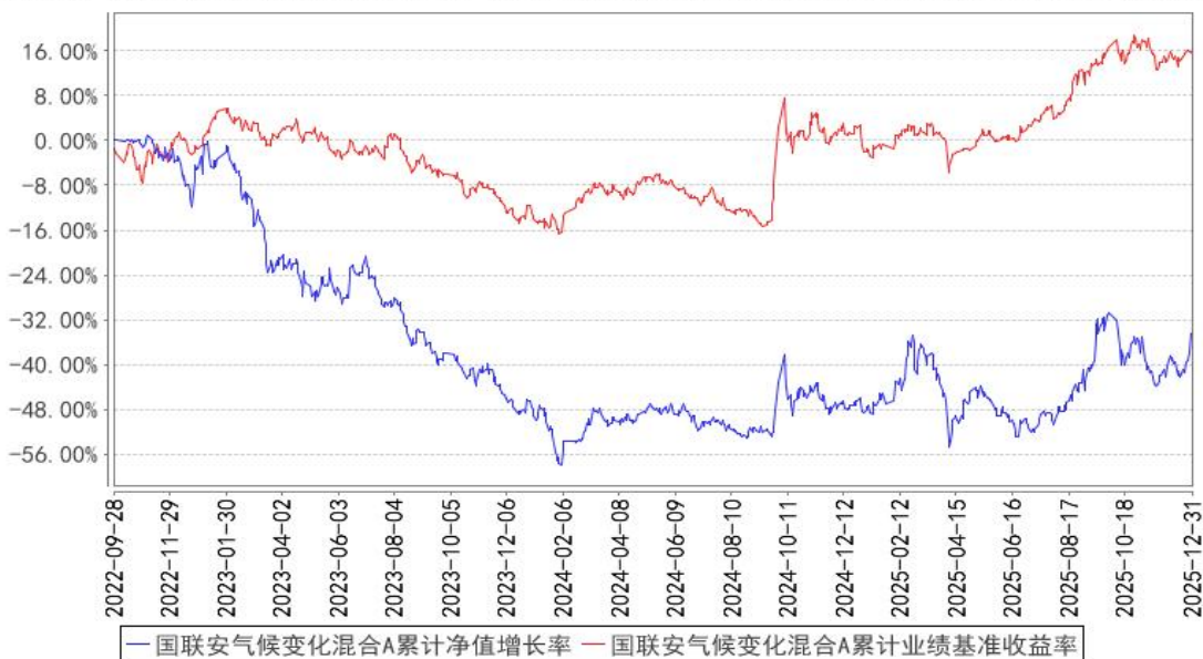
国联安气候变化混合A累计净值增长率与同期业绩比较基准收益率的历史走势对比图

注：1、国联安气候变化责任投资混合型证券投资基金于 2023 年 8 月 17 日起增加收取销售服务费的 C 类基金份额，并对本基金基金合同及托管协议作相应修改，原有的基金份额在开放申购赎回后，全部转换为国联安气候变化责任投资混合型证券投资基金 A 类份额；