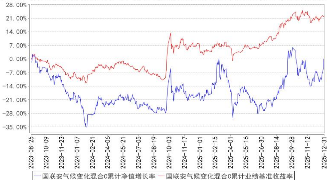
国联安气候变化混合C累计净值增长率与同期业绩比较基准收益率的历史走势对比图

4、本基金建仓期为自基金合同生效之日起的 6 个月，建仓期结束时各项资产配置符合合同约定。