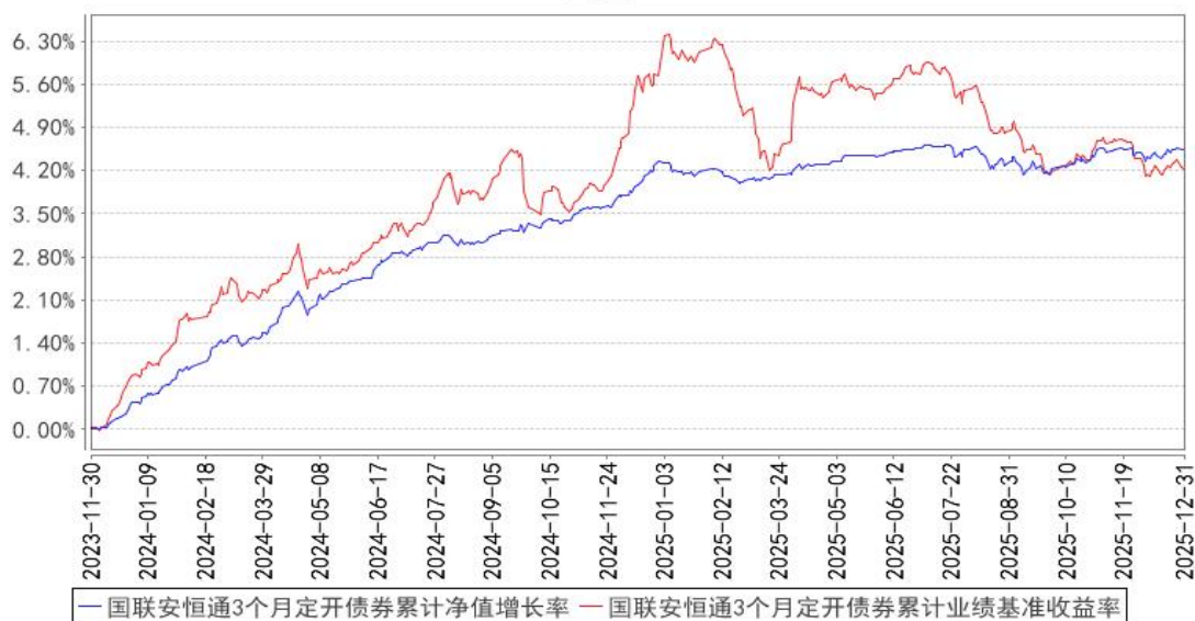
国联安恒通3个月定开债券累计净值增长率与同期业绩比较基准收益率的历史走势对比图

注：1、本基金业绩比较基准为中债综合指数收益率； 2、本基金基金合同于 2023 年 11 月 30 日生效； 3、本基金建仓期为自基金合同生效之日起的 6 个月，建仓期结束时各项资产配置符合合同约定。