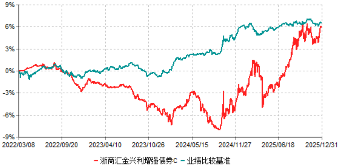
浙商汇金兴利增强债券C累计净值增长率与业绩比较基准收益率历史走势对比图 (2022年03月08日-2025年12月31日)

注：本基金合同生效日为2022年3月8日。基金合同生效日当年的相关数据和指标按实际存续期计算，不按整个自然年度计算。