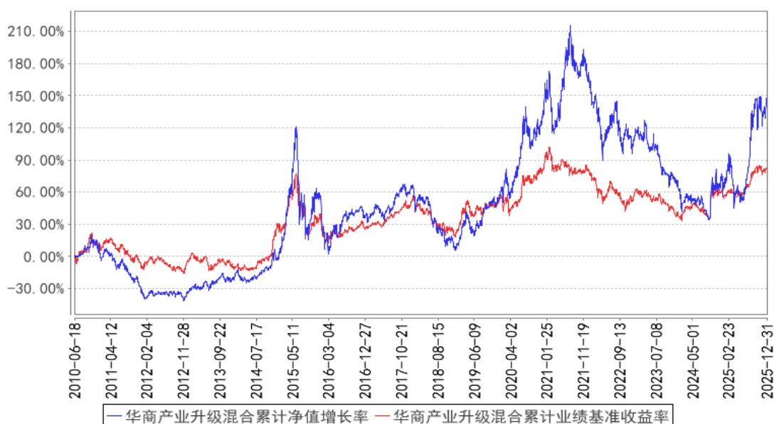
华商产业升级混合累计净值增长率与同期业绩比较基准收益率的历史走势对比图