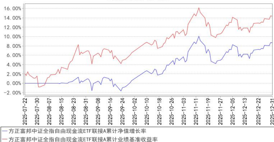
方正富邦中证全指自由现金流ETF联接A累计净值增长率与同期业绩比较基准收益率的历史走势对比图