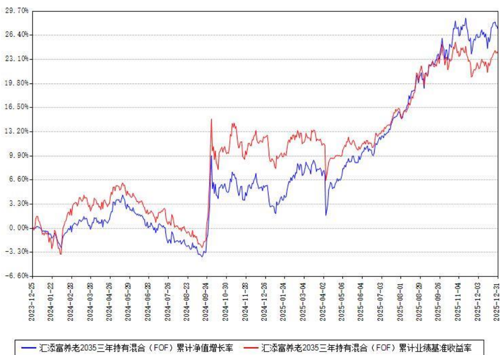
汇添富养老2035三年持有混合 (FOF) 累计净值增长率与同期业绩比较基准收益率对比图

注：本基金建仓期为本《基金合同》生效之日（2023 年 12 月 25 日）起 6 个月，建仓期结束时各项资产配置比例符合合同约定。