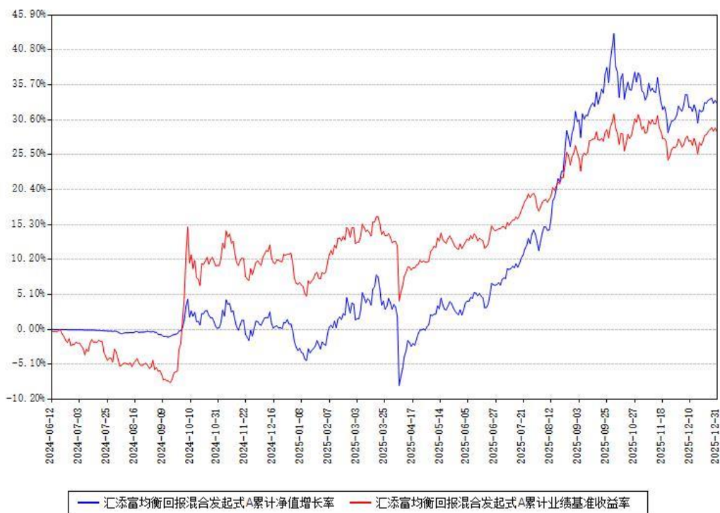
汇添富均衡回报混合发起式A累计净值增长率与同期业绩基准收益率对比图