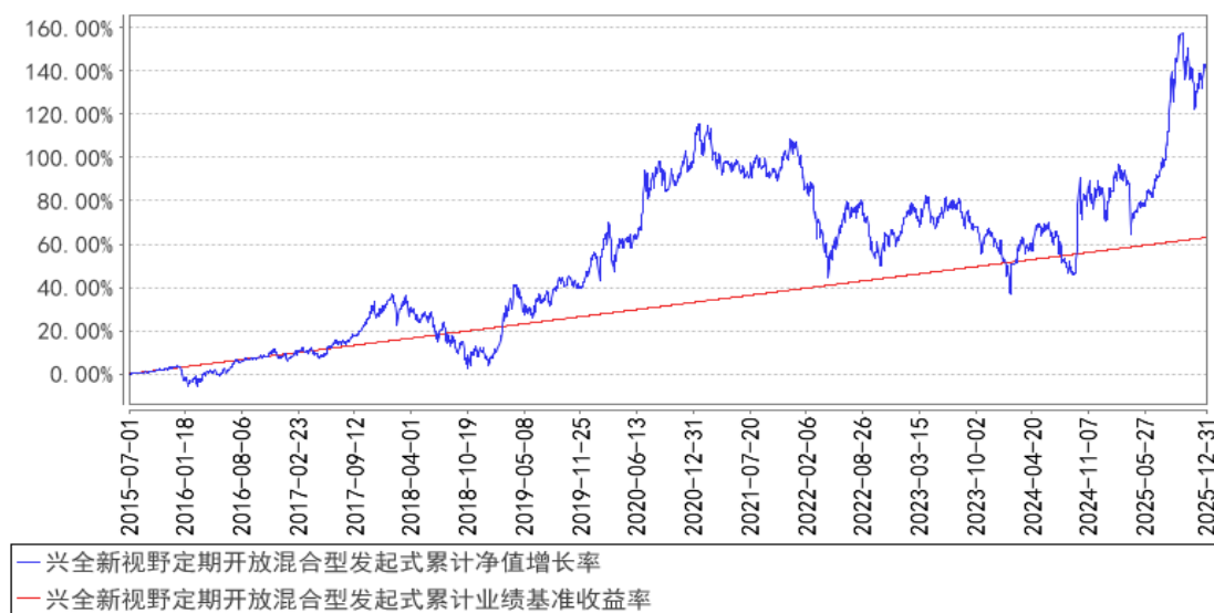
兴全新视野定期开放混合型发起式累计净值增长率与同期业绩比较基准收益率的历史走势对比图