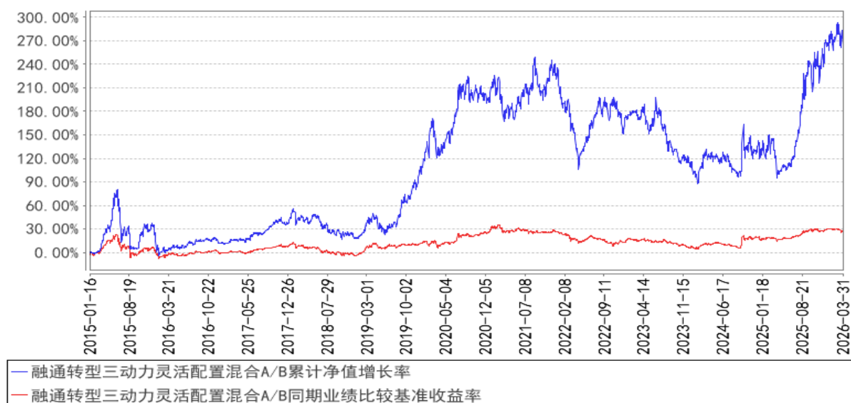
融通转型三动力灵活配置混合A/B累计净值增长率与同期业绩比较基准收益率的历史走势对比图