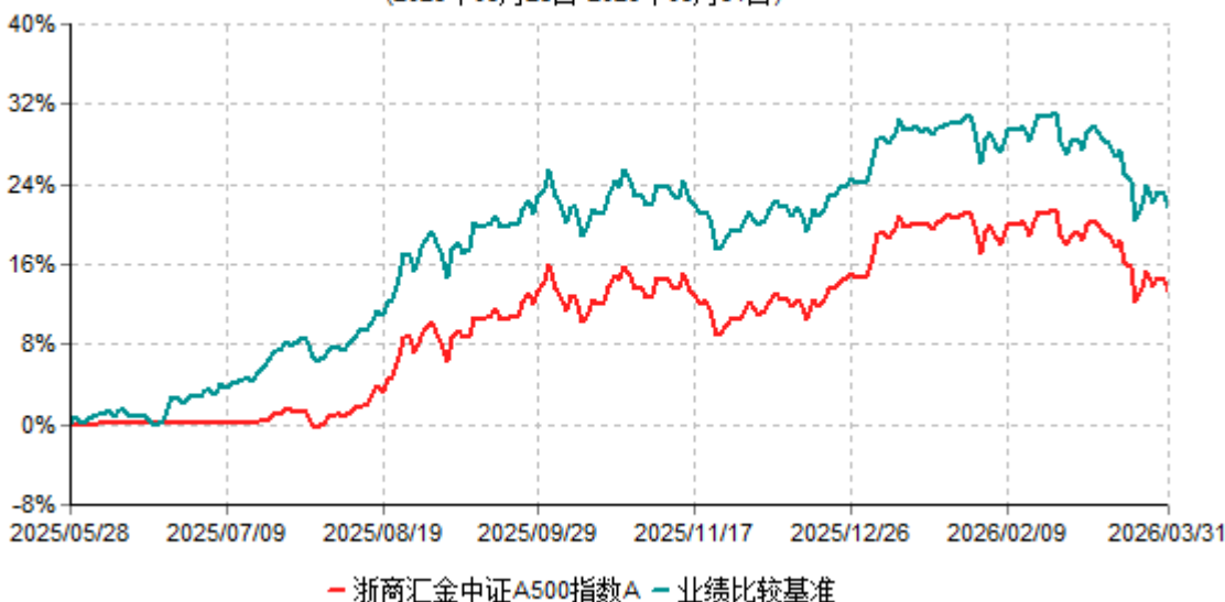
浙商汇金中证A500指数A累计净值增长率与业绩比较基准收益率历史走势对比图 (2025年05月28日-2026年03月31日)