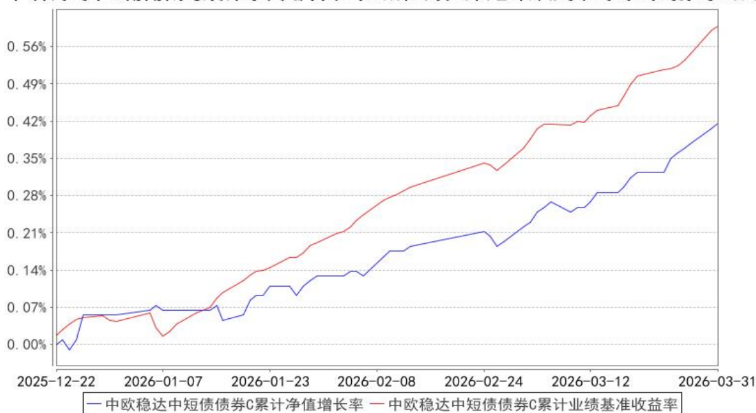
中欧稳达中短债债券C累计净值增长率与同期业绩比较基准收益率的历史走势对比图

注：本基金基金合同生效日期为 2025 年 12 月 22 日，自基金合同生效日起到本报告期末不满一年，按基金合同的规定，本基金自基金合同生效起六个月为建仓期，建仓期结束时各项资产配置比例应当符合基金合同约定。