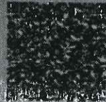
扫描二维码 Scan QR code