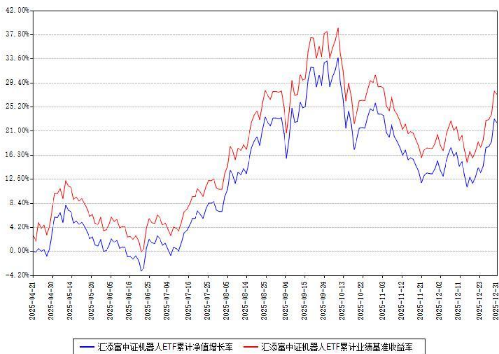
汇添富中证机器人ETF累计净值增长率与同期业绩基准收益率对比图