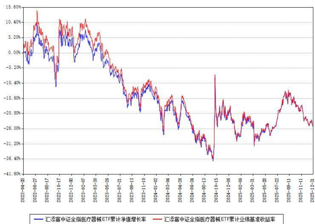
汇添富中证全指医疗器械ETF累计净值增长率与同期业绩基准收益率对比图