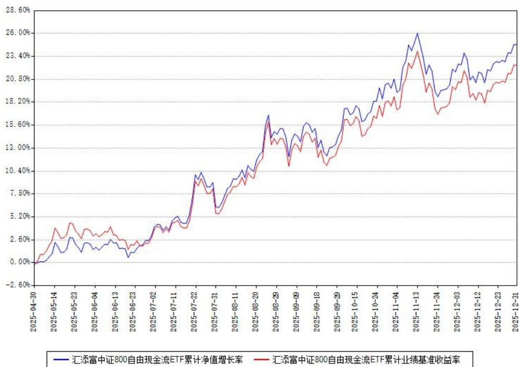
汇添富中证800自由现金流ETF累计净值增长率与同期业绩基准收益率对比图