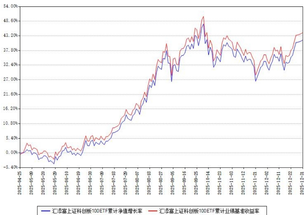
汇添富上证科创板100ETF累计净值增长率与同期业绩基准收益率对比图