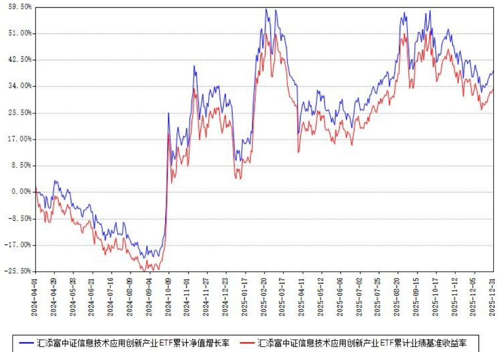
汇添富中证信息技术应用创新产业ETF累计净值增长率与同期业绩基准收益率对比图