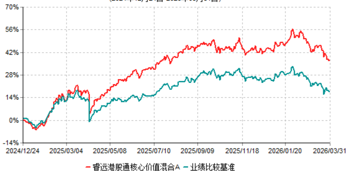
睿远港股通核心价值混合A累计净值增长率与业绩比较基准收益率历史走势对比图 (2024年12月24日-2026年03月31日)