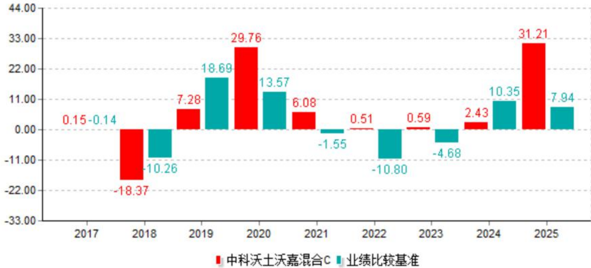
基金的过往业绩不代表未来表现；数据截止日：2025年12月31日 单位%